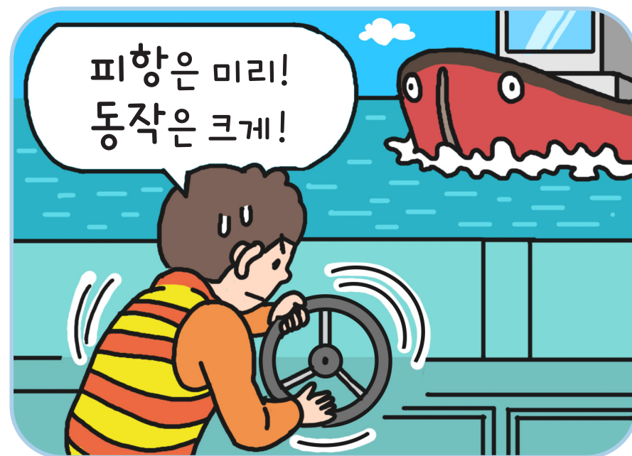
철저한 피항동작 이행