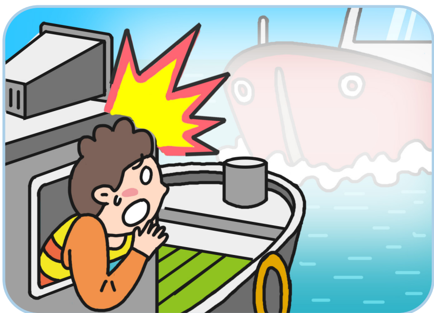
안개 등 시계 악화